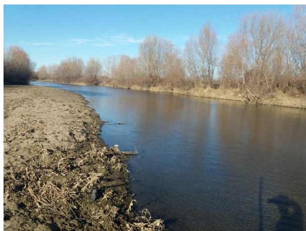
Снимка 14. Изглед към Пункт 1