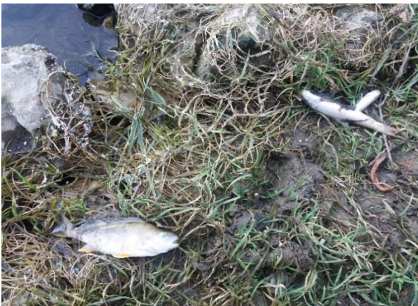
Снимка 11. Мъртви костури, мрени и кефали край Хаджиево