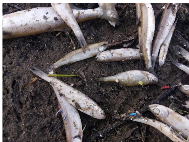
Снимка 16. Мъртви уклеи и горчивки край Огняново