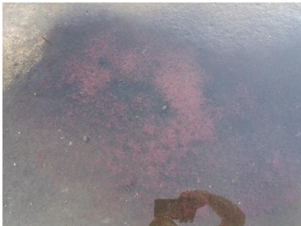
Снимка 18. Tubifex tubifex от река Марица край Огняново