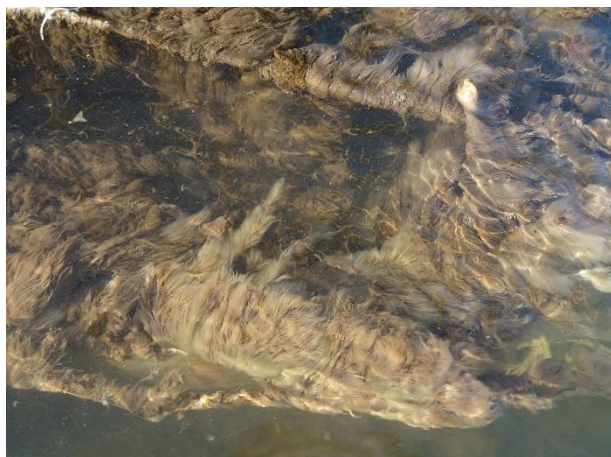
Снимка 17. Sph. natans от река Марица край Синитово