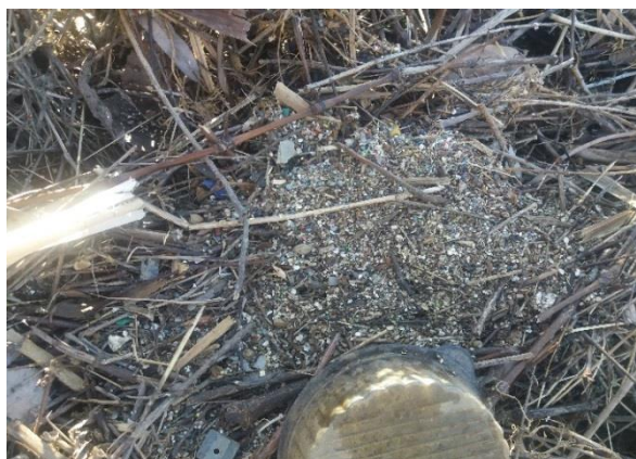
Снимка 4. Стари отложения с високо съдържание на пластмасови мленки