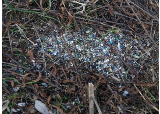
Снимка 8. Свежи отложения на пластмасови мленки край с. Огняново