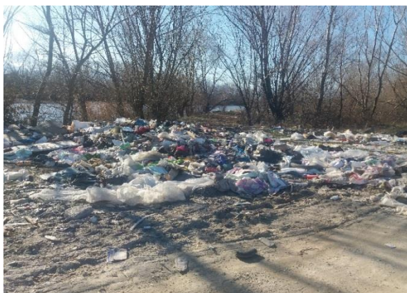
Снимка 3. Нерегламентирано сметище край река Марица в близост до пункт 8