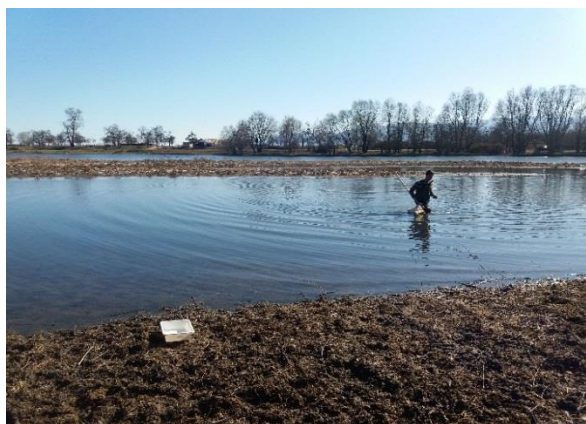
Снимка 2. Пробонабиране в река Марица в участъка след вливането на река Въча