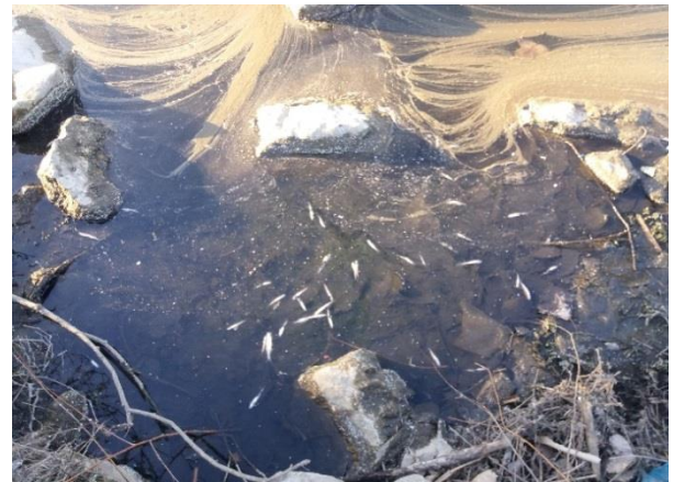
Снимка 10. Разлагащи се дребноразмерни риби от река Марица край с. Огняново