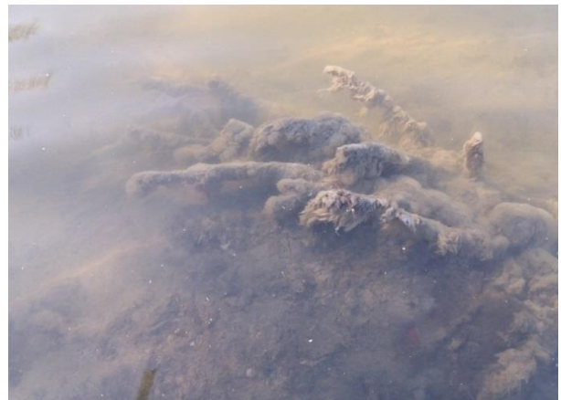
Снимка 12. Повлекла на бактерията Sph. natans от Пункт 3