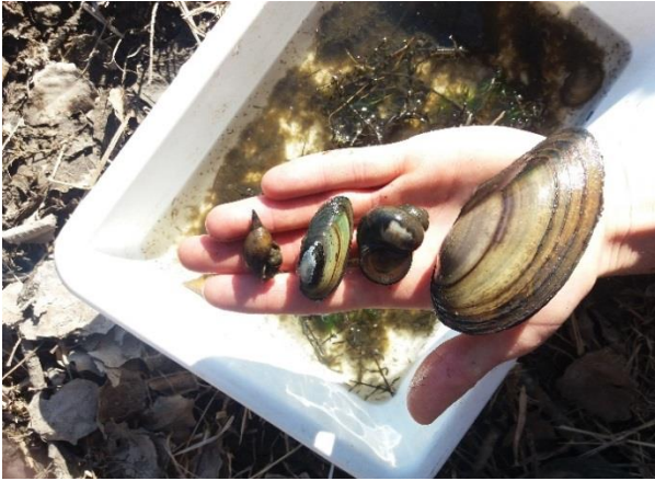
Снимка 7. Живи миди и охлюви от река Марица, Пункт 9