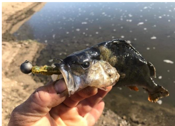
Снимка 1. Костур с поражения върху кожата и хрилете, уловен в река Марица край с. Цалапица