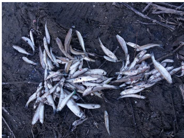
Снимка 15. Мъртви риби от река Марица край Огняново