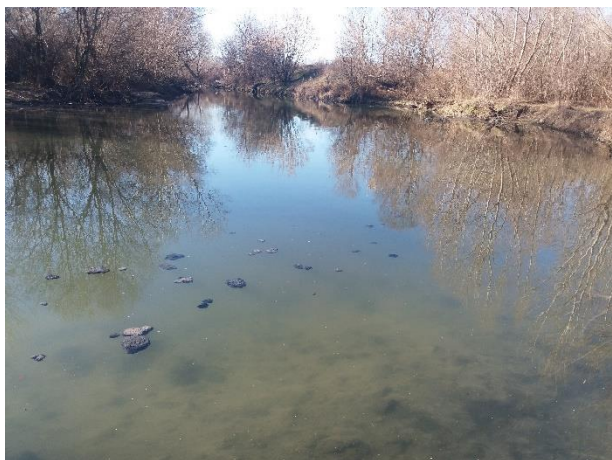
Снимка 13. Мъртвата река Пишманка, Пункт 2