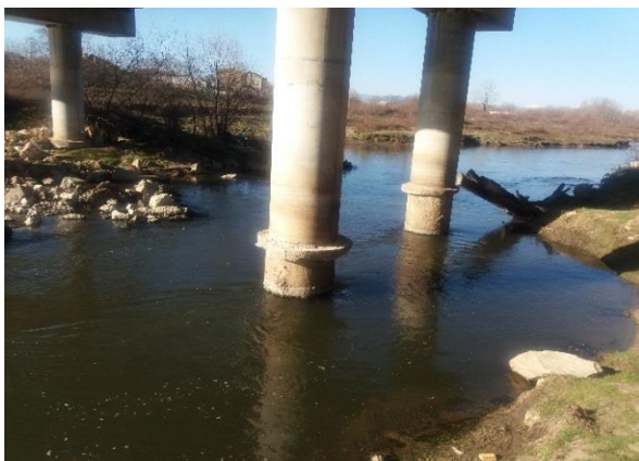
Снимка 5. Подкопани основи на моста при гр. Стамболийски