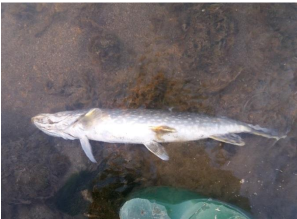
Снимка 9. Отровена щука край с. Огняново