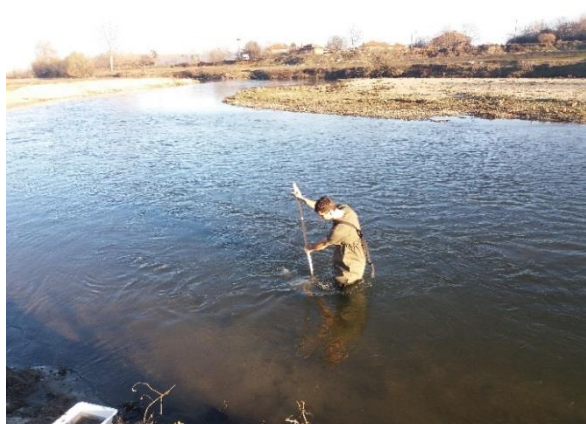
Снимка 6. Пробонабиране край с. Огняново